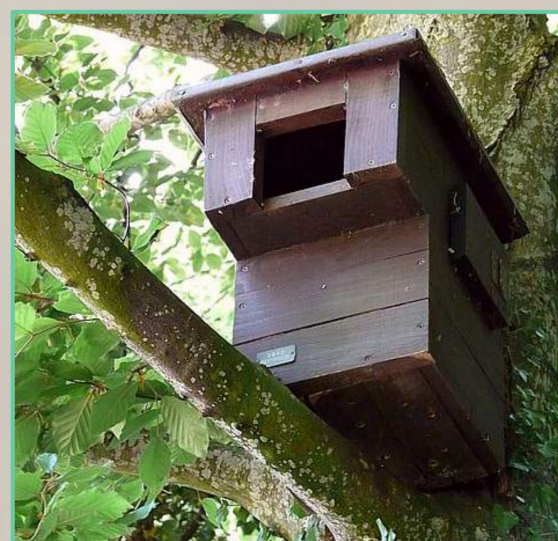
Nichoir Hulotte