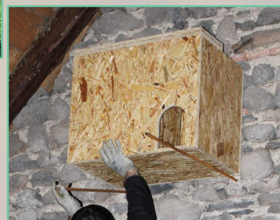
Nichoir Effraie (paysdescouzes.n2000.fr)