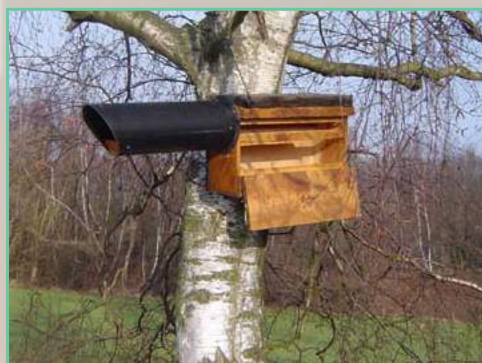
Nichoir Chevêche (verger-des-dix-bonniers.skynetblogs.be)